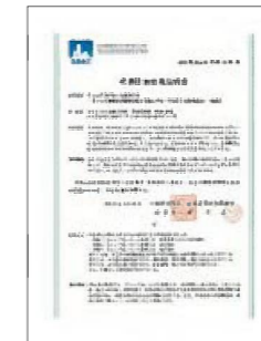
■ 建築技術性能証明 第06-03号 改定2